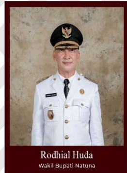
Rodhial Huda Wakil Bupati Natuna