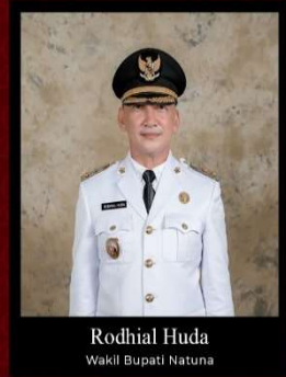
Rodhial Huda Wakil Bupati Natuna